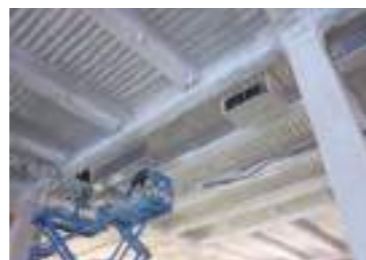
冷凍・冷蔵庫 ウレタン吹付工事