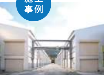
ウインドウレス鶏舎