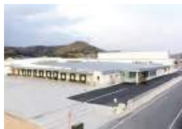
大規模GPセンター 敷地約6,000坪、建築面積約3,000坪