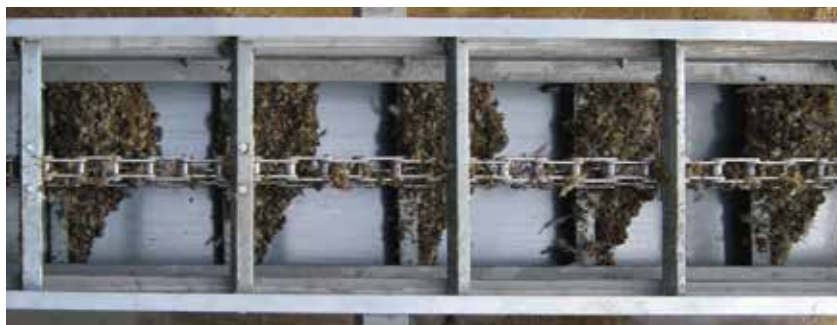
チェーンコンベア横引部