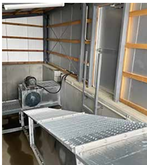
チェーンコンベア立上部