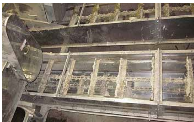
防錆のため、主な材質にステンレスを使用