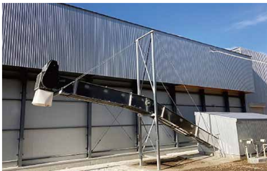
トラック積込み部と架台・ピット小屋