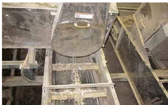
交差により進行方向を変更