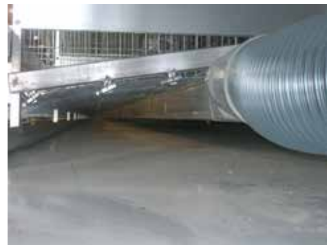
フロアから均等に風を送って鶏糞を乾燥