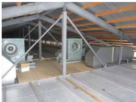
糞乾フロア・糞乾ダクト

各段に設けられた除糞ベルト上で3~4日堆積、乾燥させた後、自動的に舎外へ搬送。鶏が直接、糞に接することができない構造になっており、種々の病気から鶏を守ります。