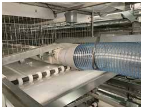
ケージ下糞乾パイプ