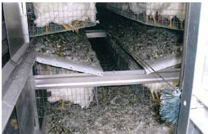
糞板と除糞ベルト(スクレパー式)