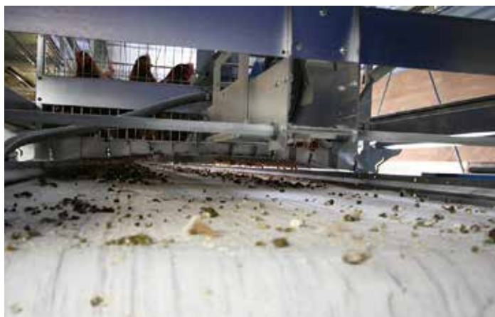
鶏糞は除糞ベルト上で乾燥後、自動的に搬出