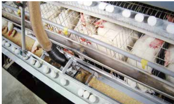
餌ならし(レベル3型)