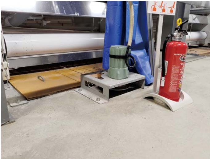
ケージ下のゴミ取りスクレパー