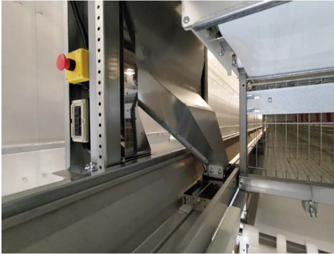
行きは給餌を行い、帰りは餌ならしのみ (往復給餌も可能)