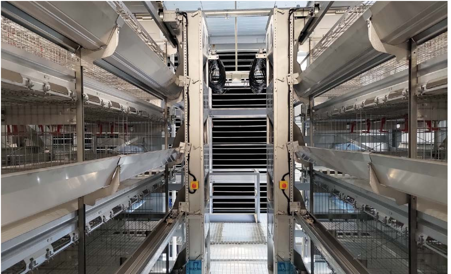
7段式中大雛舎内部