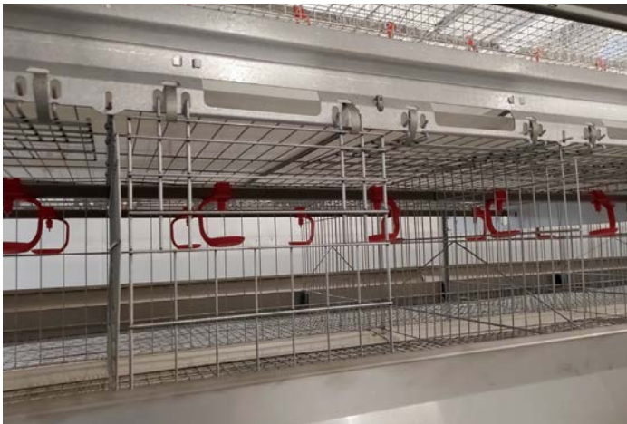
扉は2分割なので鶏の出し入れが容易