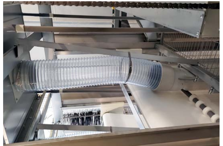
鶏糞の乾燥は大きいダクトホースで送風