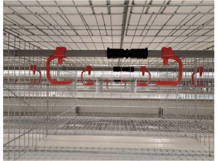
トビラは跳ね上げ方式