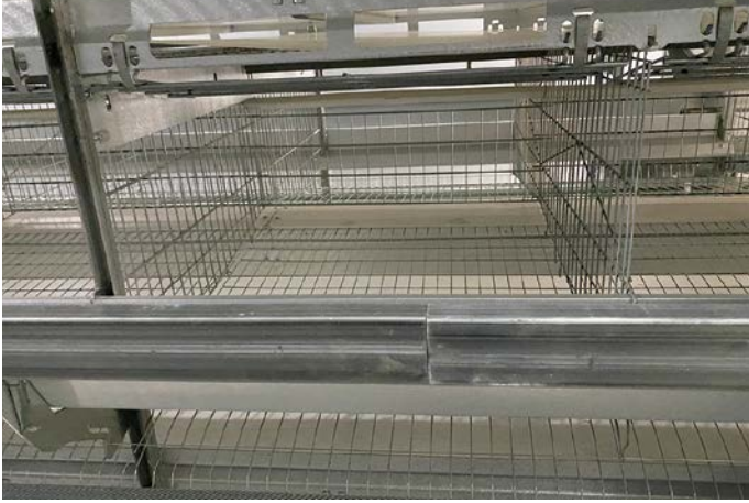
トビラは跳ね上げ方式