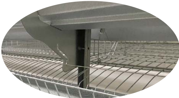
エッグガードまで見えるので洗浄が容易