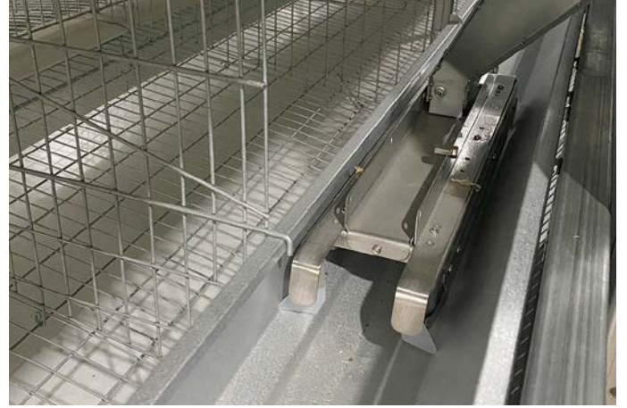
行きは給餌を行い、帰りは餌ならしのみ (往復給餌も可能)