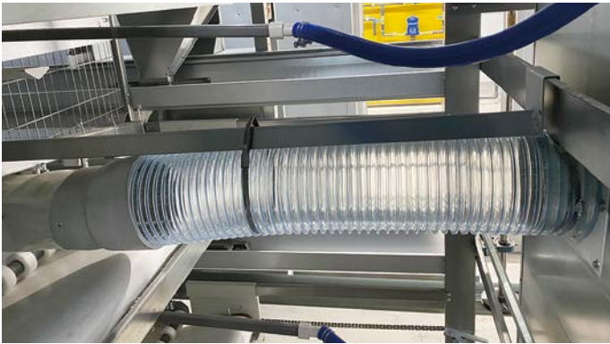
鶏糞の乾燥は大きいダクトホースで送風