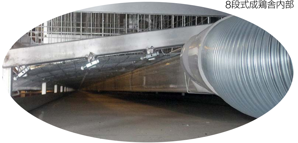
ブローから大空間に風を送って鶏糞を乾燥