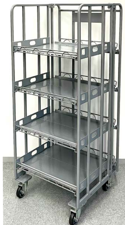
※4段タイプ（3段、4段幅広タイプもあります）