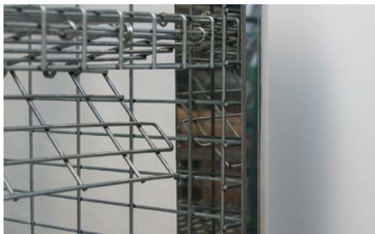
トビラは引っ掛け方式