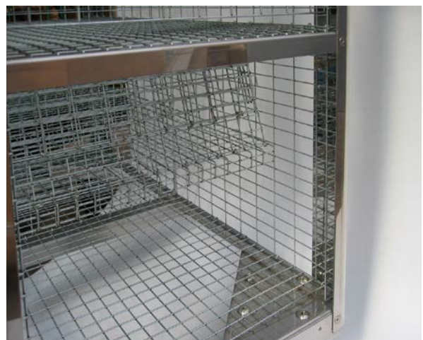
二段折りたたみ方式(2段目)